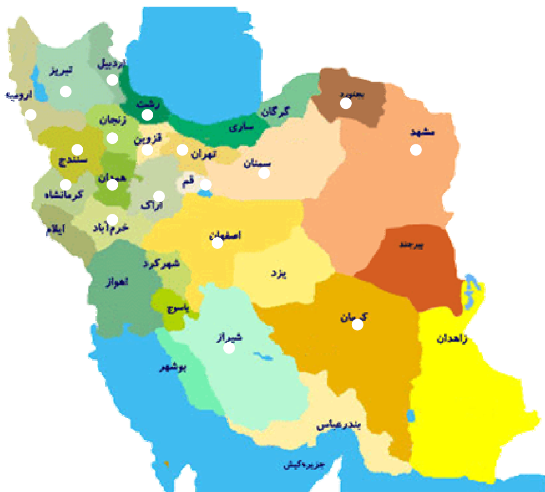
شکل ۲: انتشار بیماری آتشک درختان میوه دانه دار در ایران

نهالستان های مهم کشور در استان تهران آلوده شدند. در حال حاضر این بیماری در استان های آذربایجان شرقی، آذربایجان غربی، اردبیل، تهران، خراسان شمالی، خراسان رضوی، زنجان، سمنان، فارس، قزوین، قم، کردستان، لرستان، مرکزی، گیلان، کرمانشاه، همدان و مناطقی از استانهای اصفهان و کرمان نیز مشاهده شده و وجود آن به اثبات رسیده است (شکل ۲).